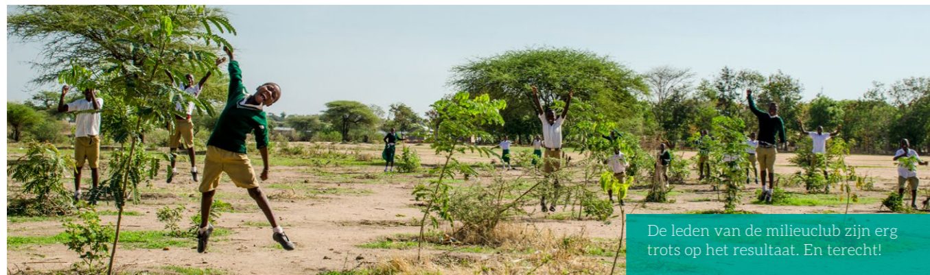
De leden van de milieclub zijn erg trots op het resultaat. En terecht!